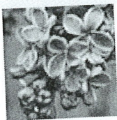
Vlatka Đipalo Dergez